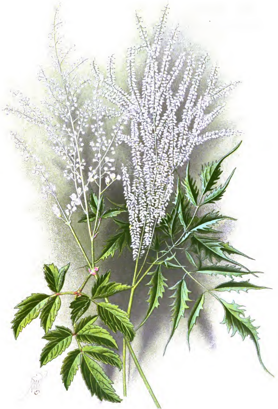
Aruncus sylvestris Kostel var. Kneiffii (Zabel), и